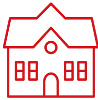
BARRERAS DE ACCESO

Basado en ambos análisis presentados anteriormente, se han identificado los problemas y posibles oportunidades/ejes de acción que permiten orientar la estrategia hacia los aspectos más relevantes y necesarios para mejorar la educación de los niños y niñas en Senegal y Colombia. Este ejercicio permite agrupar las problemáticas identificadas en 4 subgrupos que están presentados a continuación y que se han nutrido de las problemáticas evidenciadas por un recogimiento de datos a nivel macro y por observaciones cualitativas contrastadas con expertos en la materia, escritos académicos y sobre todo actores educativos comunitarios.