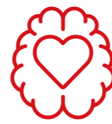
BARRERAS EMOCIONALES Y ACTITUDINALES

Las barreras didácticas o pedagógicas guardan una estrecha relación con los procesos de enseñanza y de aprendizaje; se presentan principalmente dentro del aula y el trabajo docente (aspectos de metodología, evaluación, currículo, actividades y organización del grupo, vinculación con familias...)